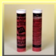
BARDAHL HTX Hochtemperaturfett Kartusche 400 g